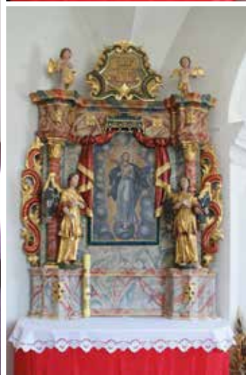
Kapela svetog Marka Križevčanina u Križevcima, unutrašnjost svetišta s oltarima iz 1731. godine i portretom svetog Marka Križevčanina, rad Zorana Homena, 1993.