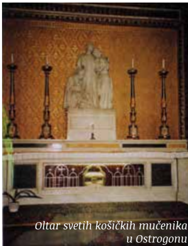
Oltar svetih košičkih mučenika u Ostrogonu