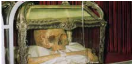
Relikvije svetoga Marka Križevčanina